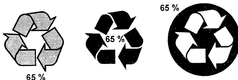
Рисунок 2 — Примеры допустимого размещения значения в процентах при использовании ленты Мебиуса

7.8.3.5 Используемый знак может сопровождаться идентификацией материала.